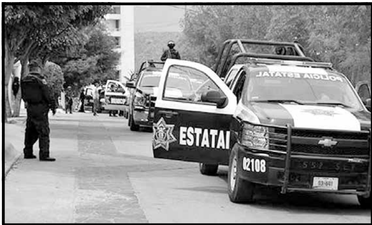
OPERATIVOS. A pesar de la vigilancia, las policías no logran abatir la inseguridad en el estado.