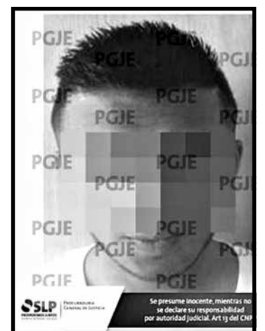
Sujeto ya está en La pila.

Luego de que se calificó de legal la detención, se logró que en la audiencia de imputación se le vinculara a proceso, concediendo un plazo de dos meses y medio para el cierre de la investigación.